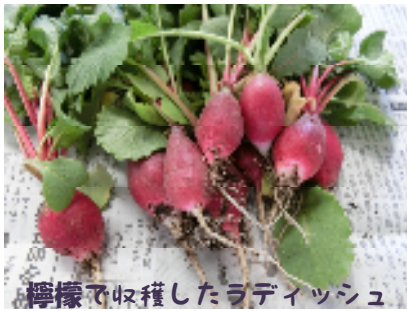
檸檬で収穫したラディッシュ